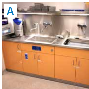
Manuelle Vorreinigung inkl. Ultraschallbecken