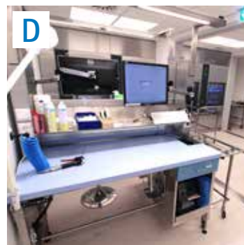
Kontrolle und Verpackung der Instrumente