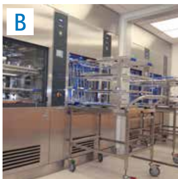
Maschinelle Reinigung und Desinfektion